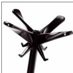
1486-N Nero lucido