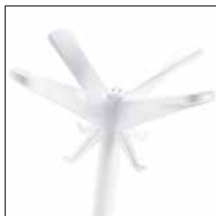
1486-B Bianco lucido