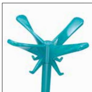
1486-OT Blu acqua (RAL 2002) lucido