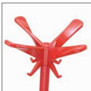
1486-AR Arancione rosso (RAL 2002) lucido